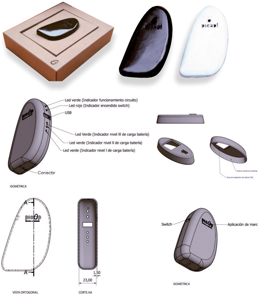
Imágenes y diagramas del prototipo de "Picap!"

While continuing with the research, there was a thermoelectric property found by the German physicist Thomas Seebeck in 1821 denominated "Seebeck effect" which is made up by different conductors of various sources or materials, exposed to different temperatures, which causes an electron flow in the conductors. This produces the generation of electricity derived from temperature differences that exist between two metals from different origins. There were identified some thermoelectric modules (TEG) that work based on the previously described phenomenon, which delivered the tools needed to finish the research and start with testing and manufacturing the final product.