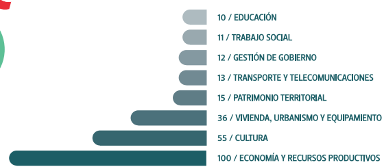
CANTIDAD DE PROYECTOS PROFESIONALES PRESENTADOS EN LA 4TA BIENAL SEGÚN ÁREA DE DESARROLLO DEL PAÍS