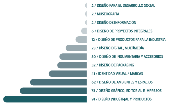
CANTIDAD DE PROYECTOS PROFESIONALES PRESENTADOS EN AMBAS BIENALES SEGÚN CATEGORÍA (376)