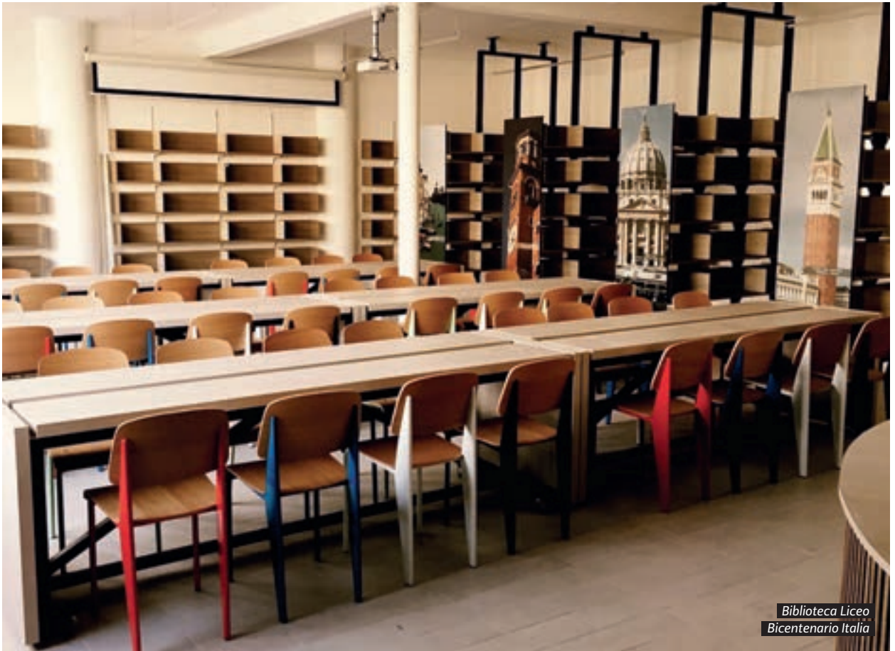
Biblioteca Liceo Bicentenario Italia