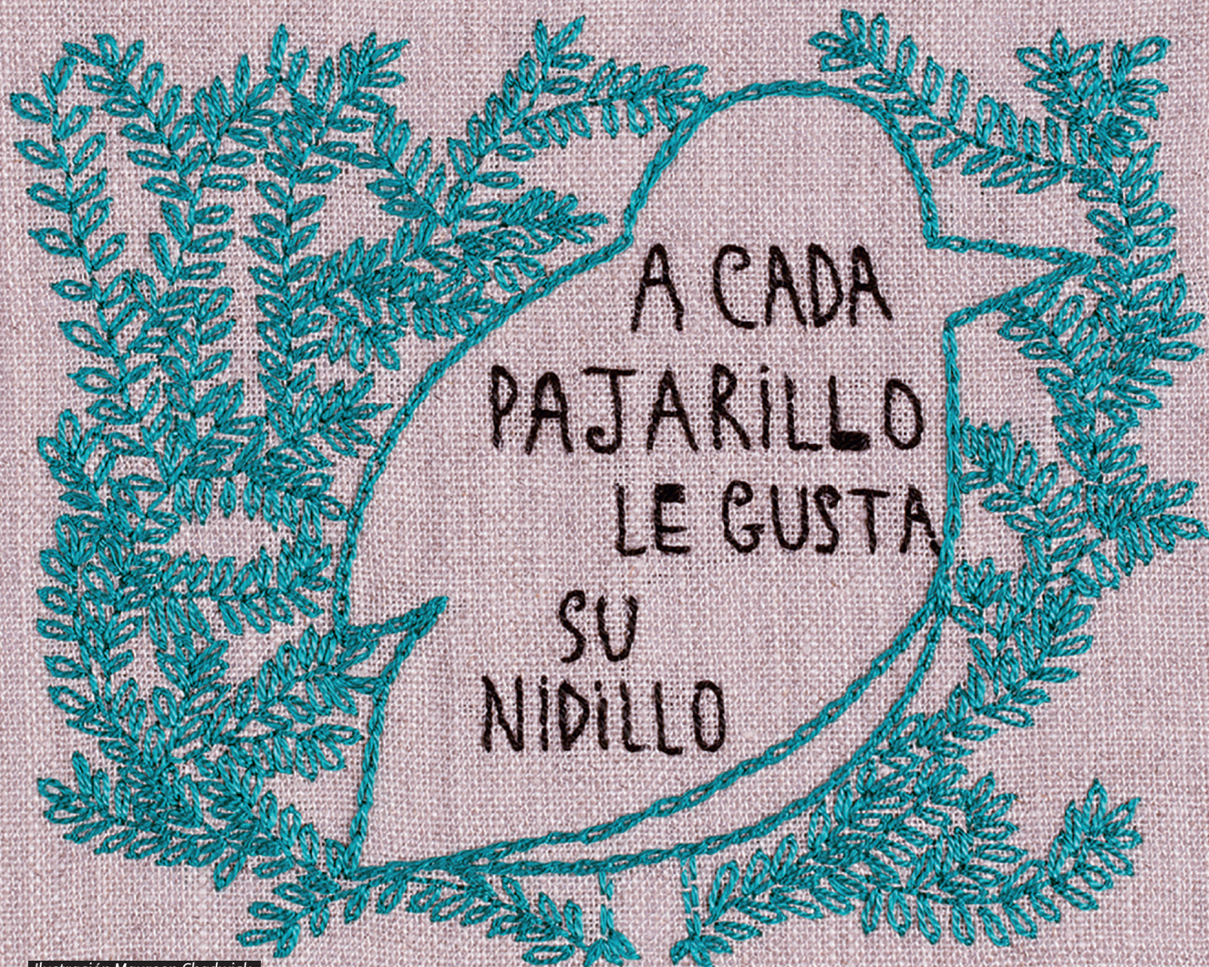
Ilustración Maureen Chadwick, "No des puntada sin hilo", Editorial Amanuta 2014