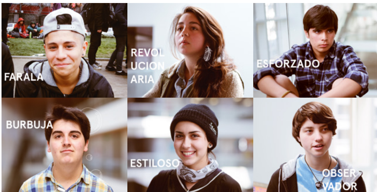
Seis perfiles que destacan comportamientos relevantes para el desarrollo del proyecto

management of their emotions, empathy and appreciation of diversity. In this way, it is concluded that the lack of tools in these three subjects is what originates the acts of violence and the normalization of this in school communities.