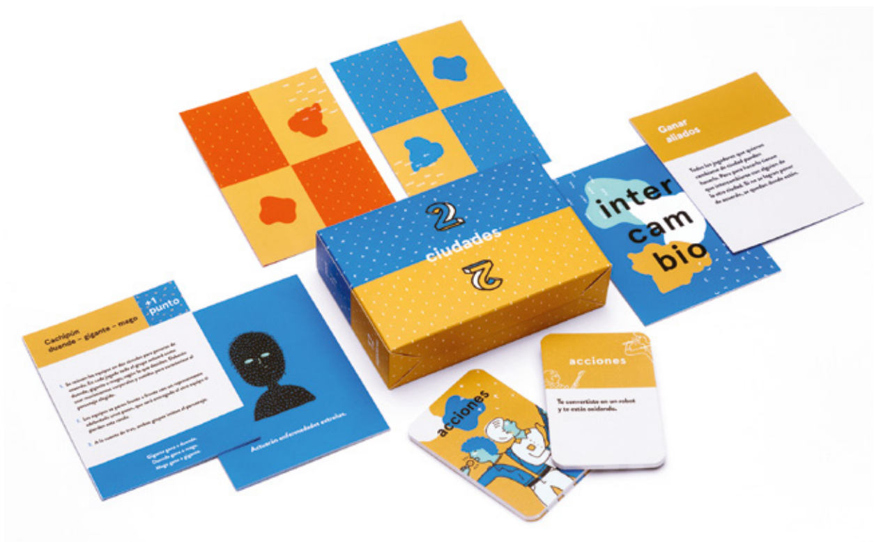
Packaging Wayna® contiene seis juegos que educan en el reconocimiento de las emociones, el desarrollo de la empatía y la valoración de la diversidad