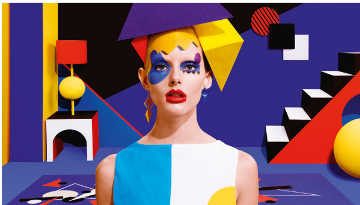
⌚ Aizone 14-16: gráficas en 3D inspiradas en pintura 2D Pop Art

Creo firmemente en el diseño local y en la comunicación visual centrada en las raíces locales. No quiero decir con esto que pongan algunos patrones tradicionales en todas partes. Significa comprender y representar qué significa vivir en Chile hoy, qué tiene de especial el país.