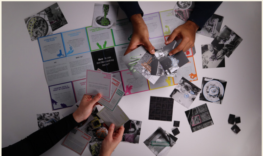
FIG. 5 La caja se despliega en un póster donde se explican las 13 categorías junto con información sobre el concepto e instrucciones sugerentes. Se trata de 34 tarjetas y 2 hojas de imanes

The box unfolds into a poster where the 13 categories are explained alongside information over the concept and suggestive instructions (Figure 5). The user is briefly informed on the ‘focus on enjoyment’ and the source of the categories. This we found enough during testing for the tool to be understood and contribute to well-being as the main focus is on firsthand experiences. After the initial information intake, the user goes through the cue cards and chooses five that appeal to them. Placing these on the fridge, the user starts experimenting through the cards as they cook in the following days.