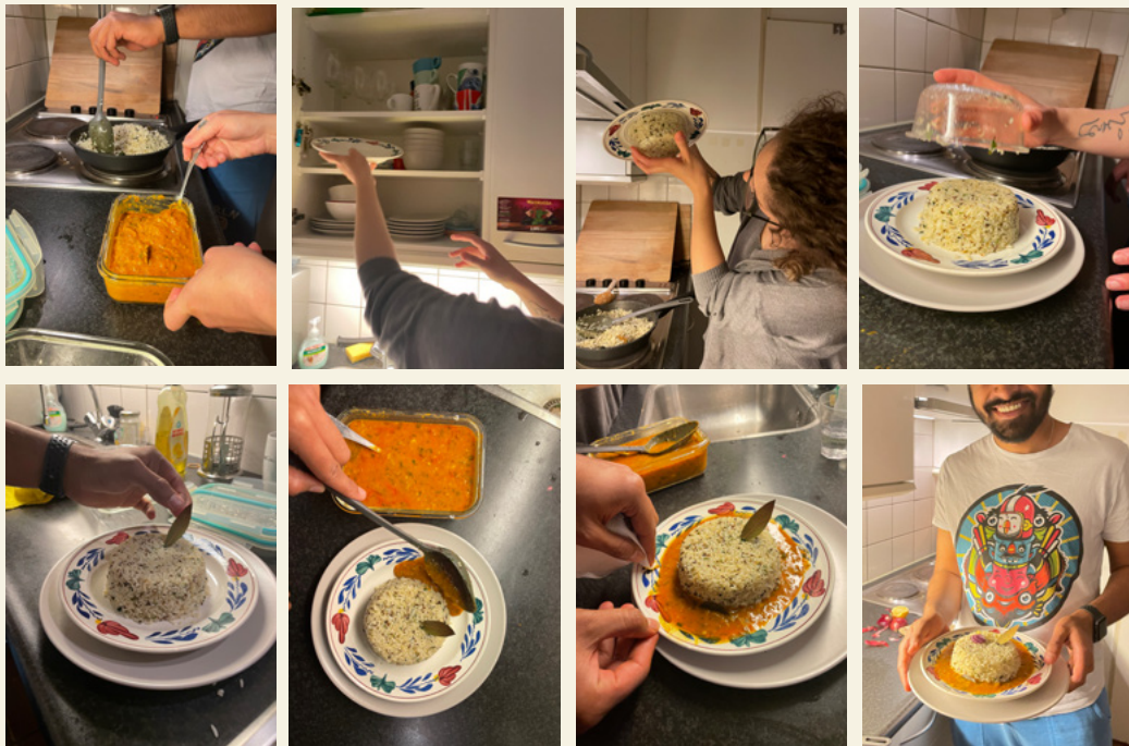
FIG. 3 Participantes durante el testeo preparando la cena en base a una tarjeta de referencia correspondiente a la necesidad psicológica de belleza: ¿cómo puede presentar sus sobras de una manera estéticamente agradable?

to well-being. Cooking with the cues on the cards was perceived as a mindful activity which enhanced the users' mood regardless of the outcomes, or the gravity of the effort put in. One of the users described their experience as “really small steps which can take the experience to a whole different level”. The experiences led by the cards were rated positively even though there were failures in terms of cooking. Focusing on enjoyment through ways of cooking allowed the users to consider cooking as, in their words, a way of taking care of themselves. Recognizing they enjoy even the ways that do not come natural to them encouraged them to explore further and get out of their comfort zone. All participants tried at least two novel ways to cook. The users also reported that some cards fit better in certain situations and make them feel better. As they got a hold of the whole set and became more fluent in realizing what they needed, this allowed them to use cooking as a way to fulfill their needs. A more detailed evaluation of the user study can be found in an internal report by Orcun (2021).