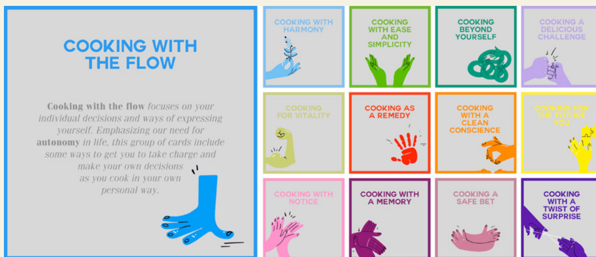
FIG. 1 Cada necesidad fundamental se tradujo en categorías relacionadas con la cocina. Las conexiones categoría-necesidad fundamental se describen al usuario en el cuadro de Unravel

based on enabling the user to focus on certain experiential qualities of their cooking, peculiar to each fundamental need. The categories gave an overall idea of the focus, however, to actually enable and stimulate the user to act and experience the fulfillment, we created specific action cues. We designed a set of cue-cards that provides a diverse catalog of activities related to cooking, 3-4 cue cards corresponding to each fundamental need. The cues represent unique aspects of each fundamental need's fulfillment based on the insights collected in our first study. These diverse approaches to the activity of cooking enable the user to focus on, and experience, a single fundamental need at a time.